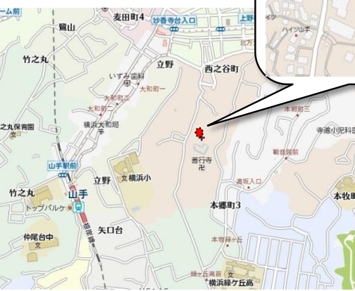
このハウジングマップは概要紹介図です。図面と現況が異なる場合は現況優先となります。